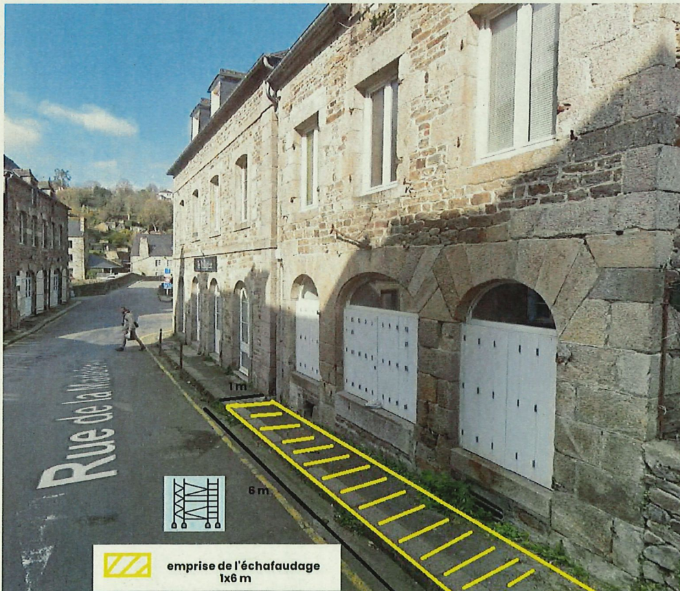
Chaussée rétrécie du 15 avril au 10 mai au 28 rue de la Madeleine