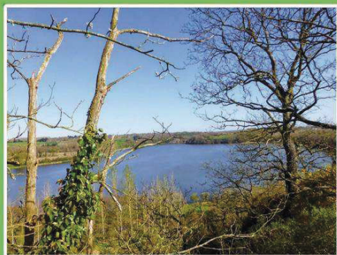
Le Saut de la Puce