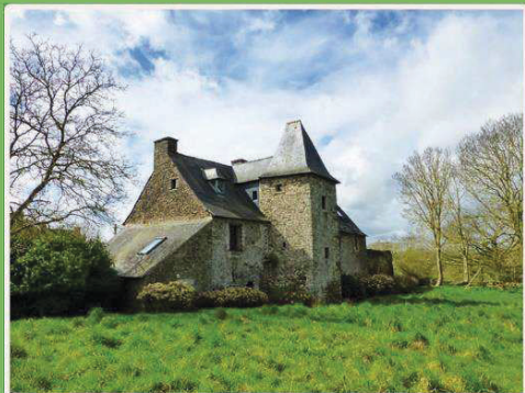
Le manoir de Landeboulou