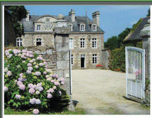
Le château de Grillemont