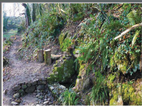
La fontaine de Monplaisir