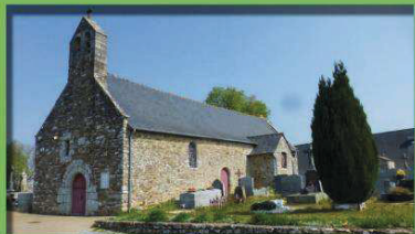
La chapelle seigneuriale