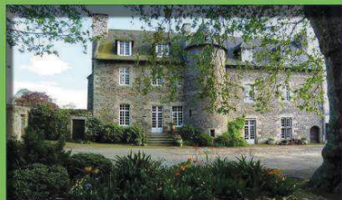
Le manoir de la Grand Cour