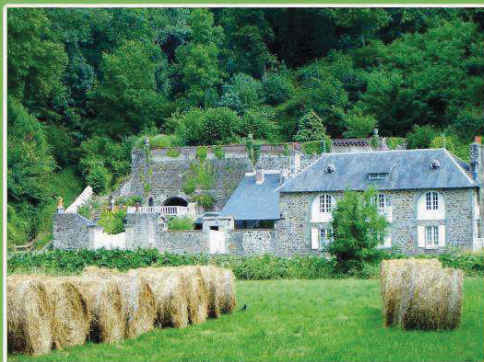
Les anciens fours à chaux

Depuis le parking de la mairie, vous traversez une partie du bourg en direction du monte-en-va . Ce chemin bucolique et ombragé, ancienne voie séculaire qui descend du Vieux bourg de Lanvallay au port, offre une vue magnifique sur les clochers de Dinan.