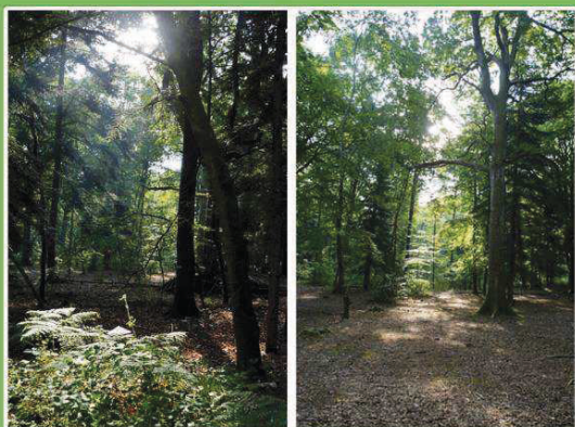
La forêt domaniale de Coëtquen